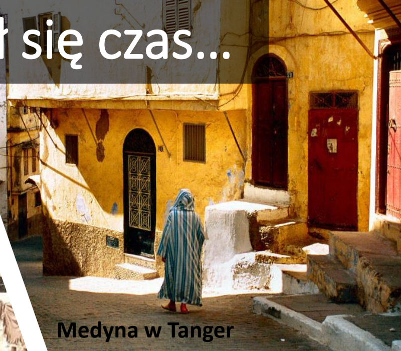
Medyna w Tanger