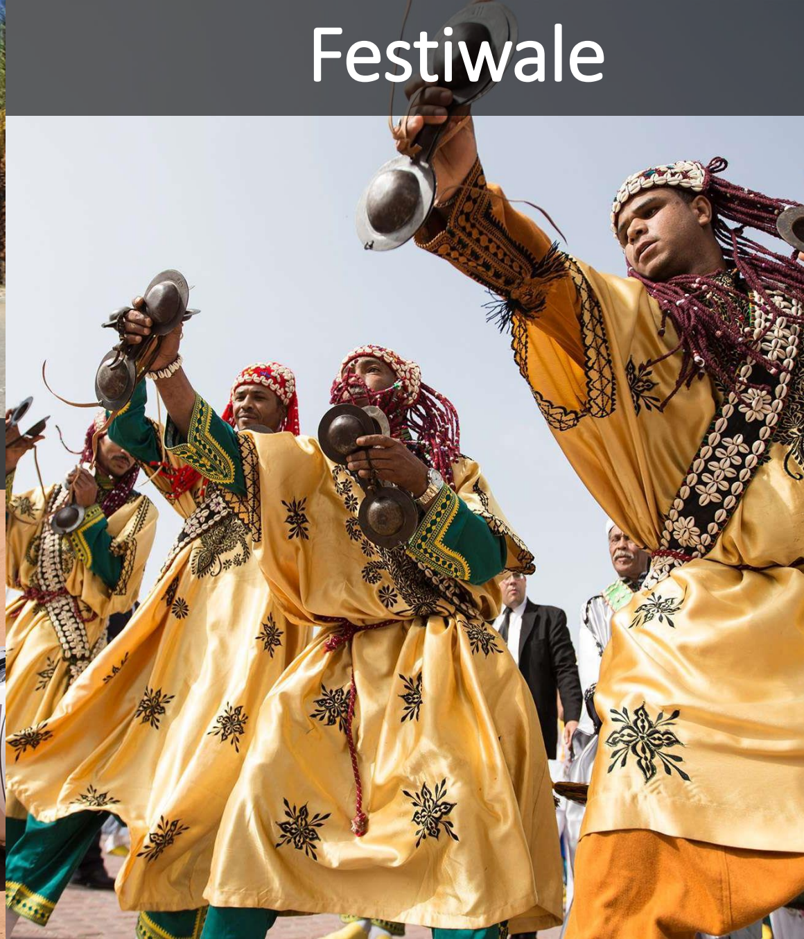
Festiwal muzyki Gnaoua