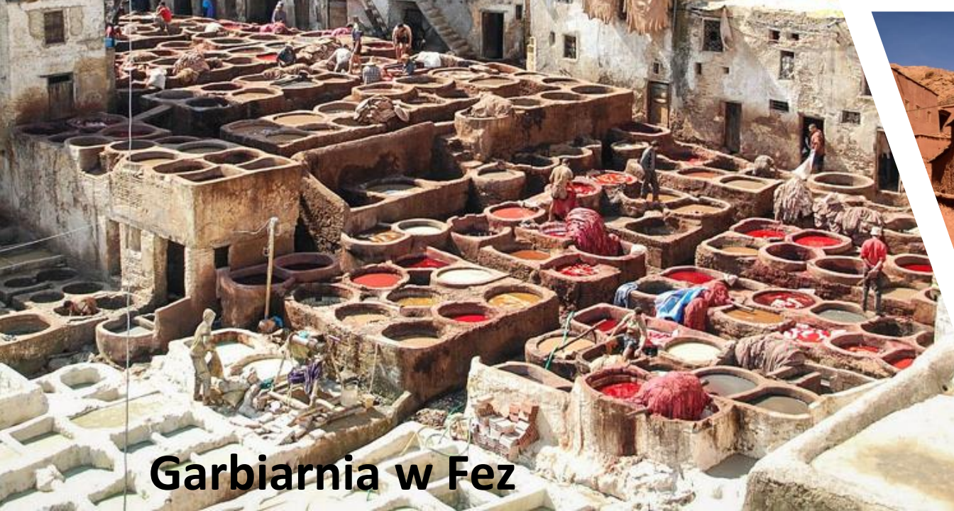
Garbiarnia w Fez