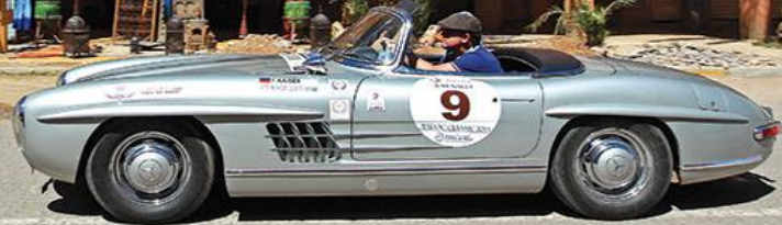
Królewski wyścig autami vintage